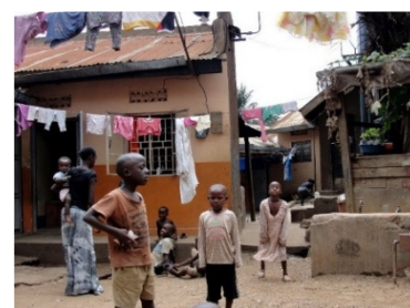
Foto rechts: een beeld van de opvang door Kayda in de wijk Katwe.

De Diaconie van de Protestantse Kerk steunt enige jaren de organisatie Kayda die straatkinderen in Kampala (Oeganda) opvangt, scholing biedt en begeleidt bij de terugkeer naar geboorteplaats Karamoja.